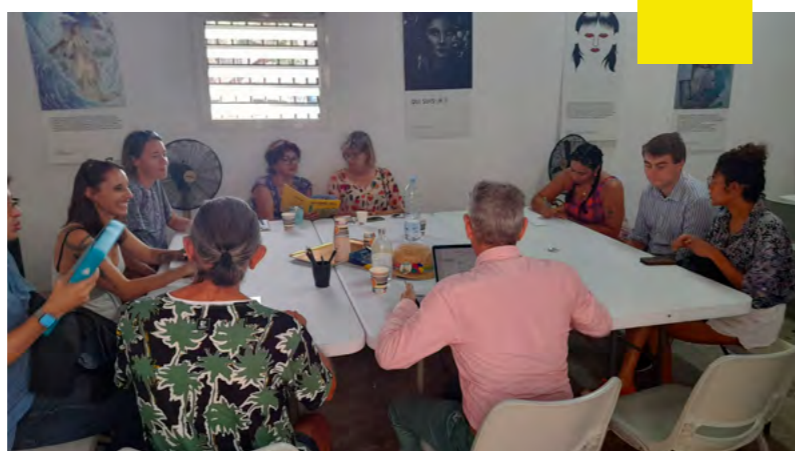
Table ronde animée par L'enVol sur la professionnalisation des artistes-auteurs (statut, droits d'auteur, interventions...)