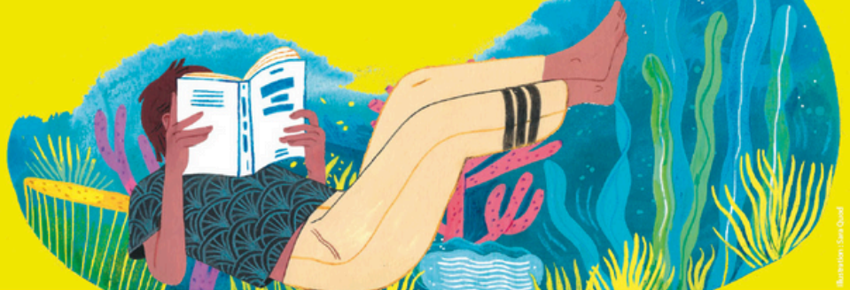
Illustration: Léa David