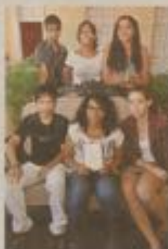
DE HAUT EN BAS :