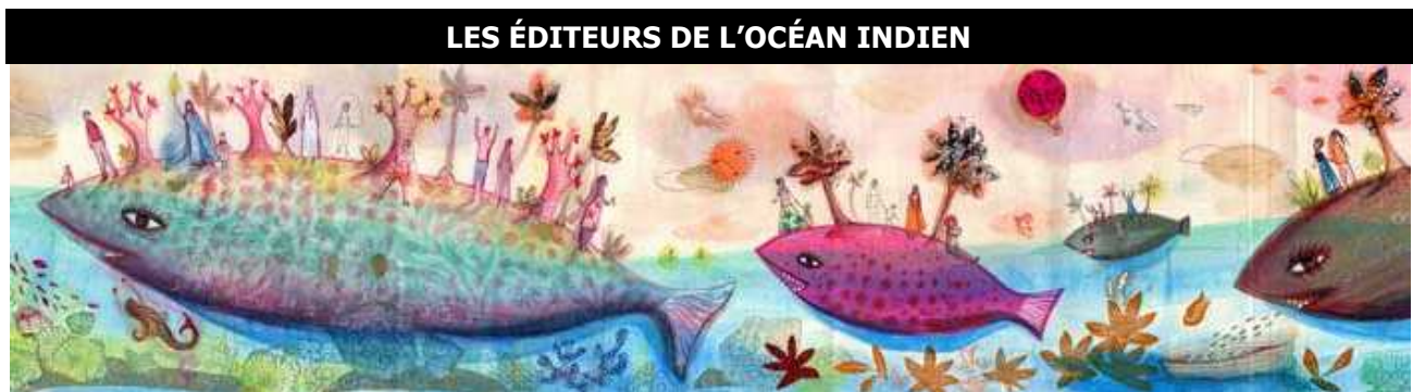
Illustration : Gabrielle Wiehe

Cette année encore Kambo assure le design du stand à partir des illustrations réalisées par Gabrielle Wiehe , graphiste et illustratrice mauricienne vivant et travaillant à Paris. Un grand visuel et deux kakémonos signaleront le stand dans l’espace d’exposition.