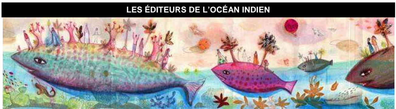
Illustration : Gabrielle Wiehe

Cette année encore Kamboo a assuré le design du stand à partir des illustrations réalisées par Gabrielle Wiehe , graphiste et illustratrice mauricienne vivant et travaillant à Paris. Un grand visuel et deux kakémonos signalaient le stand dans l'espace d'exposition.