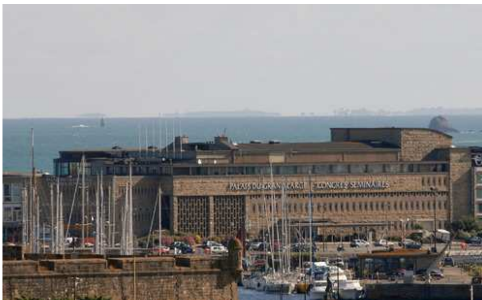
2010 : Palais Le Grand Large

Le stand était installé à l' Espace Duguay-Trouin , réservé aux éditeurs indépendants.