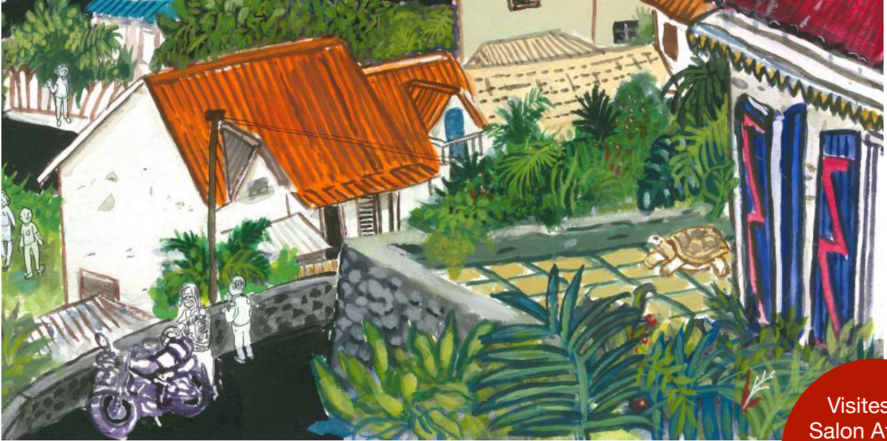
Extrait d'illustration de l'album La balade de Little Momo de Moniri M'Baé, éditions Zébulo éditions

Visites du Salon Athena pour les familles de Liv La Kaz