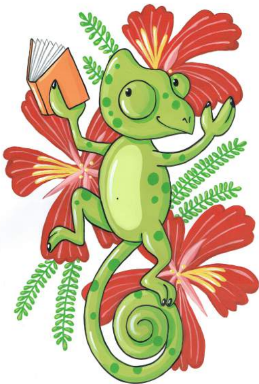
Illustrations de Modeste Madoré

Pour les fans de dragons et de fantastique, découverte de Carter Brims avec Marie-Danielle Merca suivi d'un atelier « Deviens le héros de ta propre histoire! » (à partir de 7 ans)